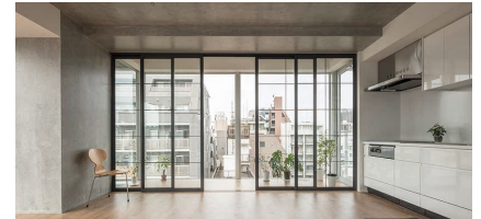
Grand Louvre 麻布十番