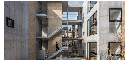
日本基礎技術日吉寮