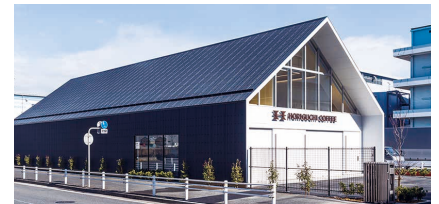
堀口珈琲 横浜ロースタリー