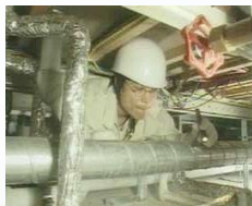
床下での点検の様子