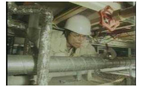
床下での点検の様子