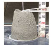
スランプ130のフレッシュコンクリート